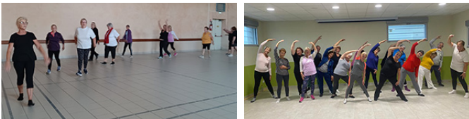
Noël à la gym