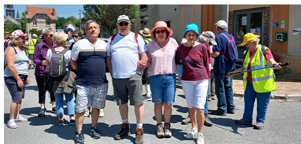
© La marche moyenne 17 personnes