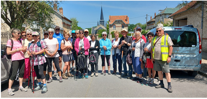
© La grande marche 25 personnes.