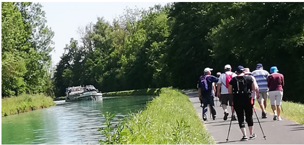
Des petites pauses à l'ombre s'imposent