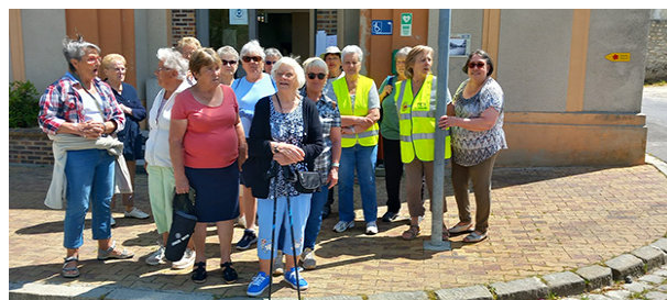
© La petite marche 15 personnes.